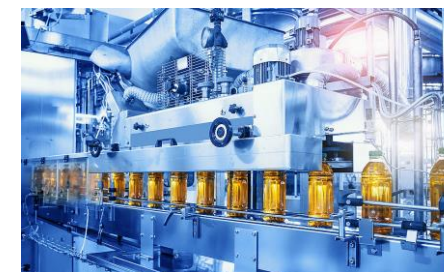
| Producție industrială