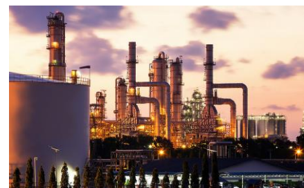
| Energie și utilități